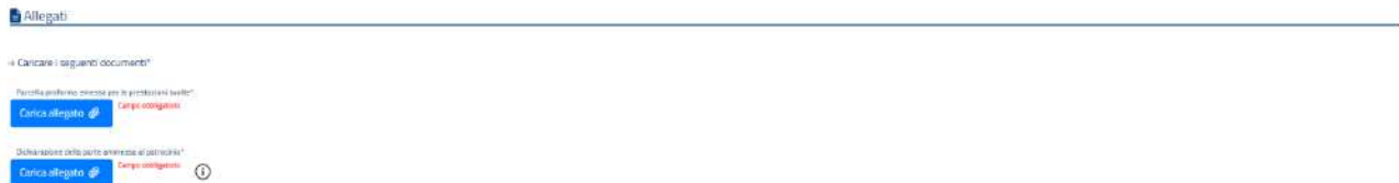
Figura 10 Nuova istanza - Allegati

Nella quarta sezione, Allegati , l'utente deve allegare i seguenti documenti: la parcella pro forma emessa per le prestazioni svolte in favore della parte ammessa al patrocinio a spese dello Stato e la dichiarazione della parte ammessa al patrocinio in ordine alla permanenza delle condizioni reddituali previste dall'articolo 15-ter del decreto legislativo n.28/2010 e dall'articolo 11-ter del decreto-legge n.132/2014;